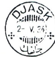
Djask 2- V. 34