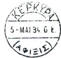
Corfu 5-MAI 34