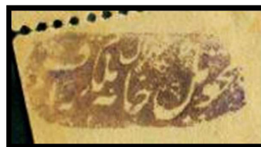
مهر تحویل خانه تلگراف تهران